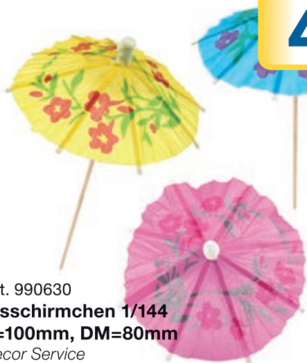
Art. 990630 Eisschirmchen 1/144 L=100mm, DM=80mm Decor Service