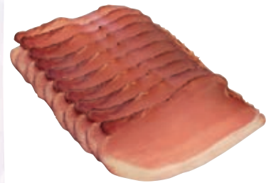
Art. 011879 Frühstücksspeck geschn. 500g Greisinger