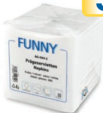
Art. 012849 Servietten 32x32cm 1/500 1 Lagig, Weiß Funny