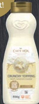
Carte d'Or Crunchy Topping White Chocolate 019335, Gewicht: 900 g