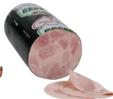
Art. 715897 Bauernschinken o.S. 1/2 vac ca. 1,6 kg Greisinger