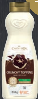
Carte d'Or Crunchy Topping Chocolate 018547, Gewicht: 900 g