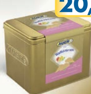
AUER Waffelherzen 1/200 827510