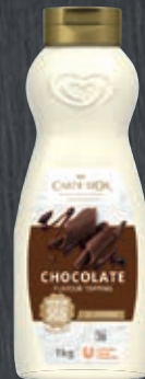
Carte d'Or Topping Schoko 011192, Gewicht: 1 kg