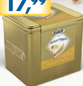
AUER Dekorhippen 1/400 827480