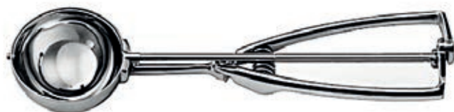
Art. 017000 Eisportionierer Edelstahl DM=30mm Rist