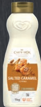
Carte d'Or Topping Salted Caramel 019336, Gewicht: 1 kg