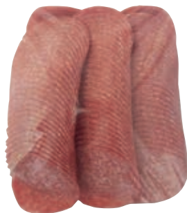
Art. 716010 Karreespeck 1/2 vac m. Schwarte ca. 1,6 kg Greisinger