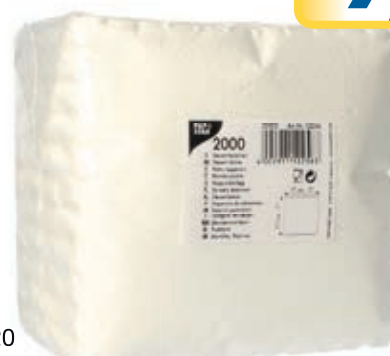
Art. 016920 Dessertdeckchen 1/2000 17x17cm Papstar