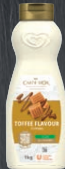
Carte d'Or Topping Toffee 012578, Gewicht: 1 kg