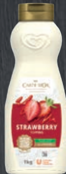
Carte d'Or Topping Erdbeer 011406, Gewicht: 1 kg