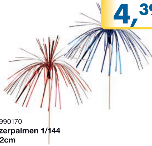
Art. 990170 Glitzerpalmen 1/144 L=22cm Decor Service