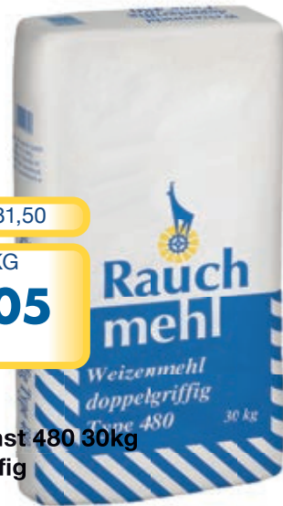
Art. 118700 Weizendunst 480 30kg Doppelgriffig Rauch Anton