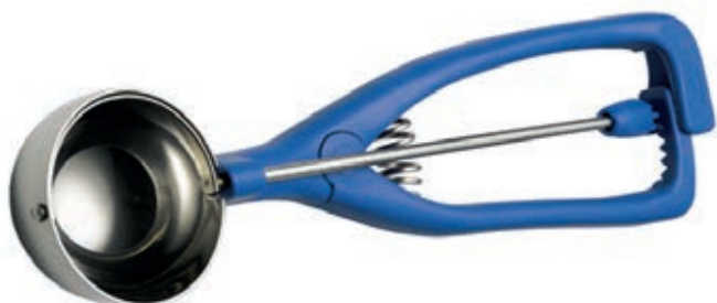
Art. 017032 Eisportionierer Kunststoff DM=49mm Rist