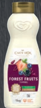
Carte d'Or Topping Waldfrucht 011387, Gewicht: 1 kg