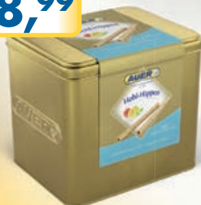
AUER Hohlhippen 1/200 827490